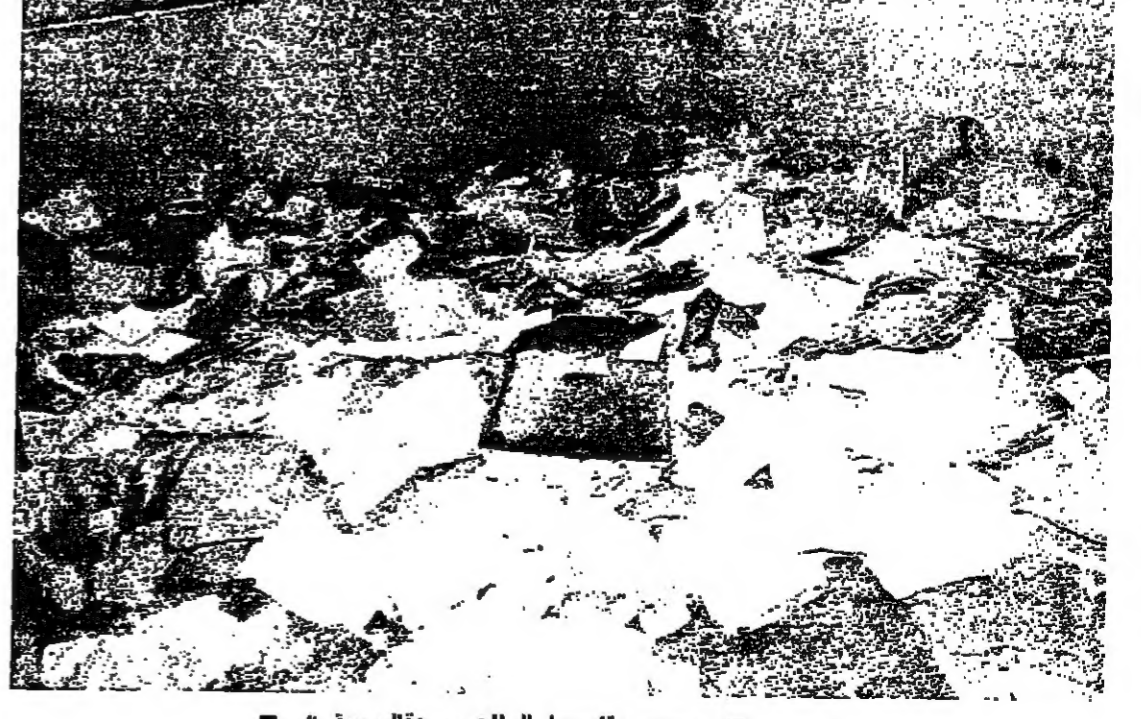
ممن بقاسا «الجريدة الرسمية»